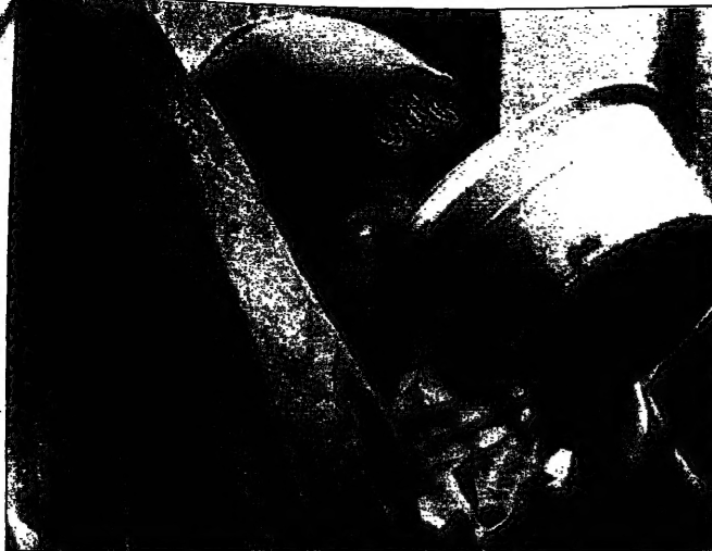
ميدان تربية السواريل يمتلئ بالمتطوعين المسجلين على مساعدات طاقية في بغداد